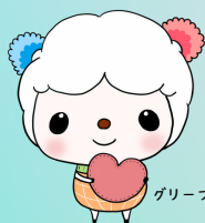
グリーフケア福井 公式マスコットキャラクター 「コットン」