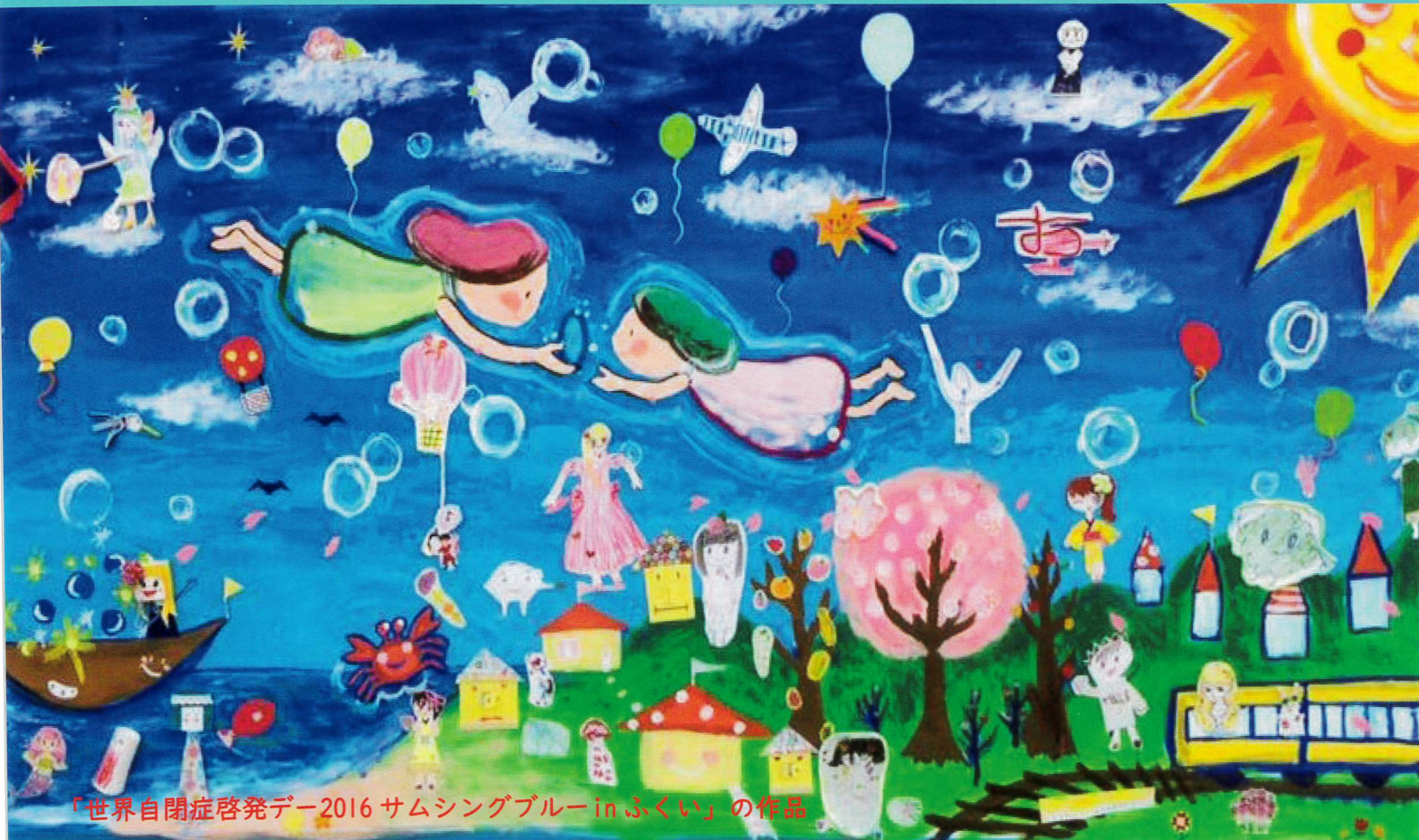
「世界自閉症啓発デー2016 サムシングブルー in ぶくい」の作品