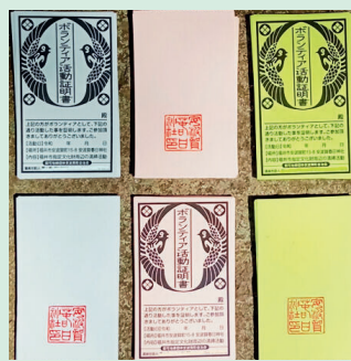
ボランティア活動証明書