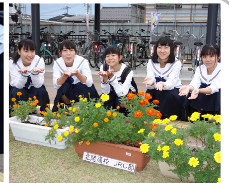
(お花でおもてなし)

「福井しあわせ元気国体・障がい者スポーツ大会」で全国から訪れる方々をおもてなししようと、北陸高校JRC部が、部員全員で心を込めて育てたお花(プランター20基分)を田原町駅前(えちぜん鉄道側)に設置しました。