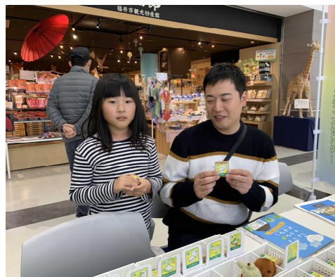
省エネワークショップ(11月23日) (NPO法人 エコプランふくい)