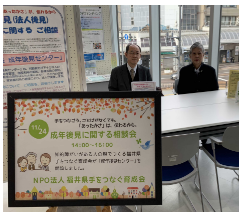
成年後見に関する相談会(11月24日) (NPO法人 福井県手をつなぐ育成会)