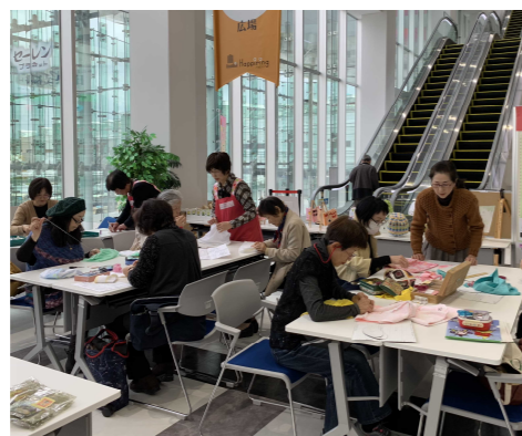
タオルケア帽子作り(11月23日) (グリーンケア福井タオルケア帽子の会)