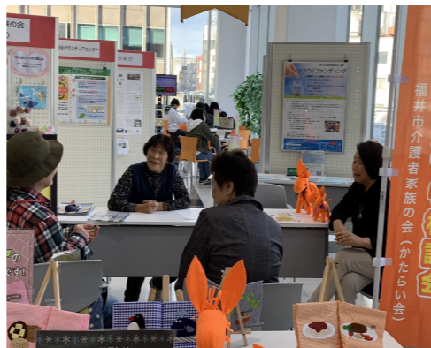
介護なんでも相談(11月24日) (福井市介護者家族の会(かたらい会))