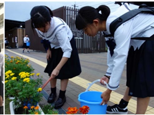
(プランターの花に水やりする部員)