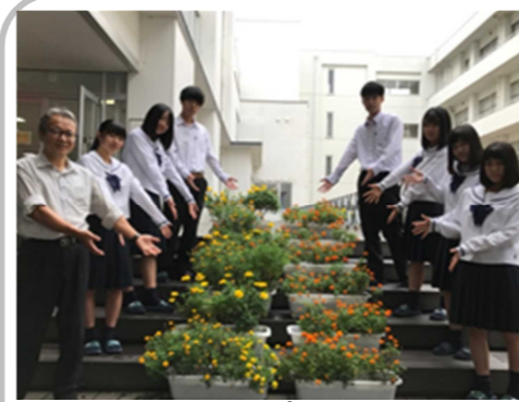
(田原町駅にお花のプランターを寄贈)