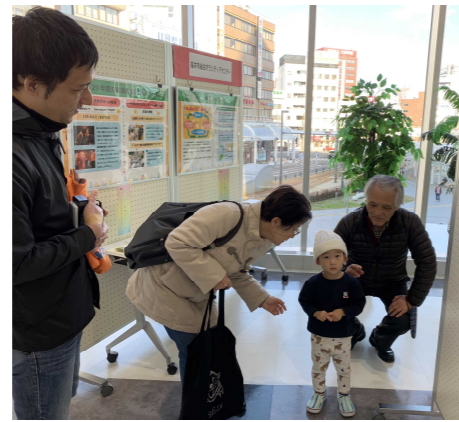
福井しあわせ元気国体・大会 写真展(11月25日) (福井市国体 広報ボランティア)