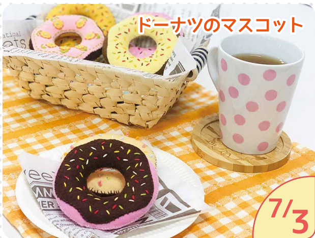
ドーナツのマスコット