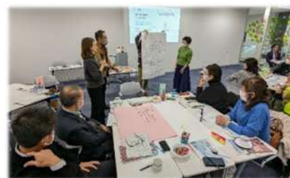
市民活動の担い手づくり講座

北陸新幹線 福井県内開業で福井駅前はおおいに賑わいました。ボランティアセンターでは、開業を前に市民が主役のおもてなし活動について考えるワークショップを開催しました。