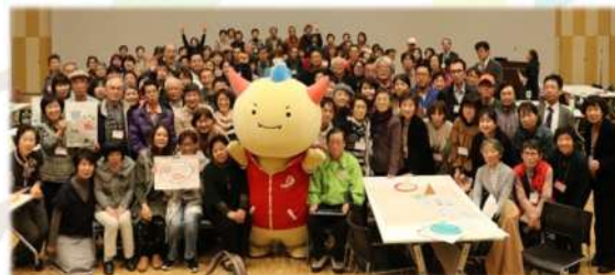
市民ボランティア大同窓会

「福井しあわせ元気」国体・障害者スポーツ大会では、多くのボランティアスタッフが50年ぶりの県内開催となる大会を支えました。