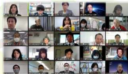
オンラインでの講座を開催

新型コロナウイルスの流行はボランティア活動や市民活動にも影響を与えました。ボランティアセンターでは、感染症対策を徹底しながら講座を開催しました。