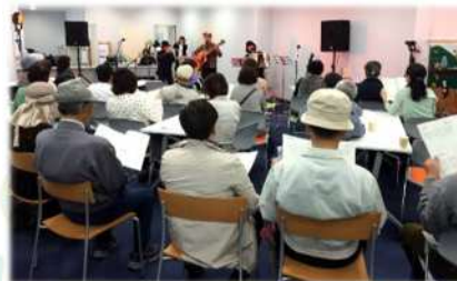
センターオープニングイベント

JR 福井駅西口にハピリンが誕生。これまでアオッサで活動していた「福井市 NPO 支援センター」の機能を引き継ぎながら「福井市総合ボランティアセンター」がオープンしました。